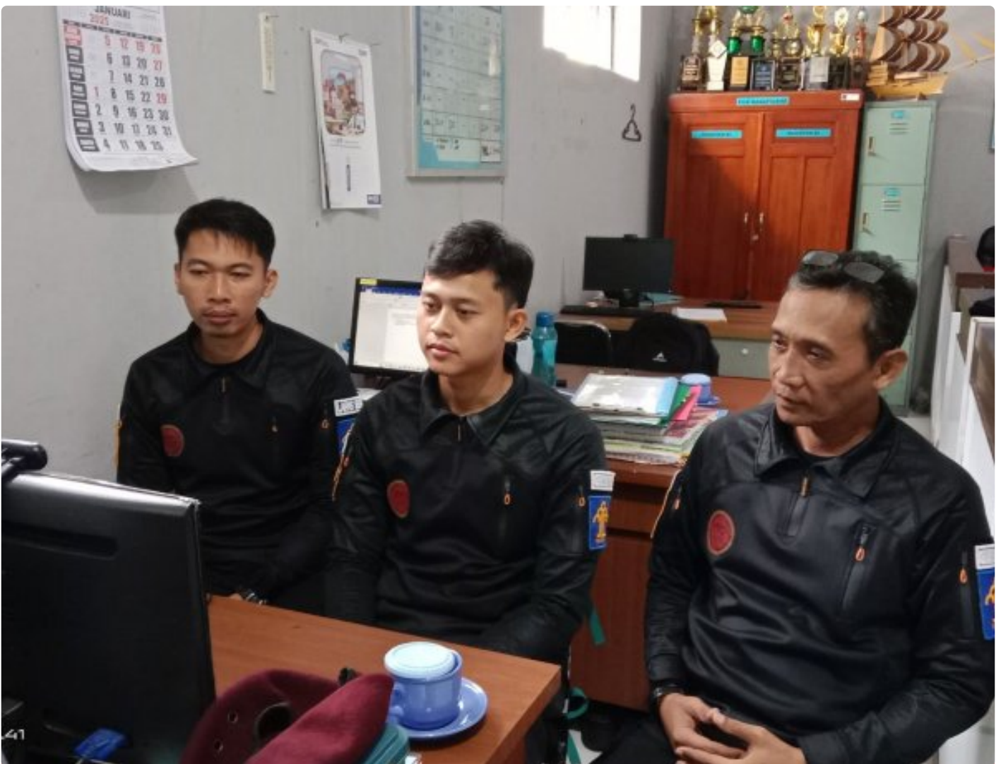
Bangun Harmoni dan Strategi, Lapas Besi Ikuti Webinar Refleksi Akhir Tahun 2024 & Resolusi 2025

CILACAP – Sebagai salah satu langkah dalam pengembangan kompetensi bagi Aparatur Sipil Negara (ASN), Petugas Lembaga Pemasyarakatan Kelas IIA Besi berpartisipasi dalam kegiatan webinar bertajuk "Refleksi Akhir Tahun 2024 dan Resolusi 2025", Rabu (18/12/2024).